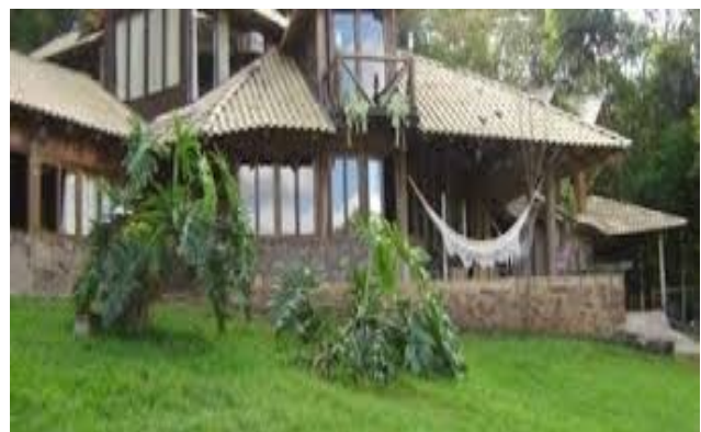
Fazenda 3 Cascatas