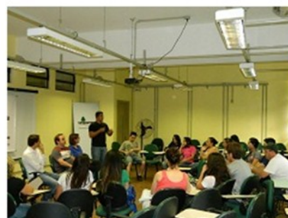
Fórum Ciência e Tecnologia de Alimentos