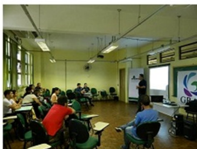
Fórum Int. em Ciência e Tecnologia