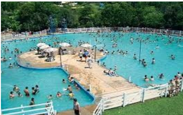
Balneário das Fontes