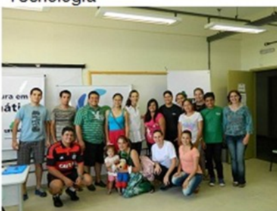
Fórum Licenciatura em Matemática