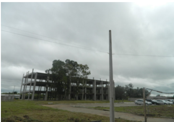
Prédio acadêmico III

Subestações III e IV: obra licitada em 18/11/2014, tendo como vencedora a empresa Fuchs Construções. A previsão da Coordenadoria de Obras da Instituição é que a ordem de serviço ocorra ainda na 1ª quinzena de fevereiro.