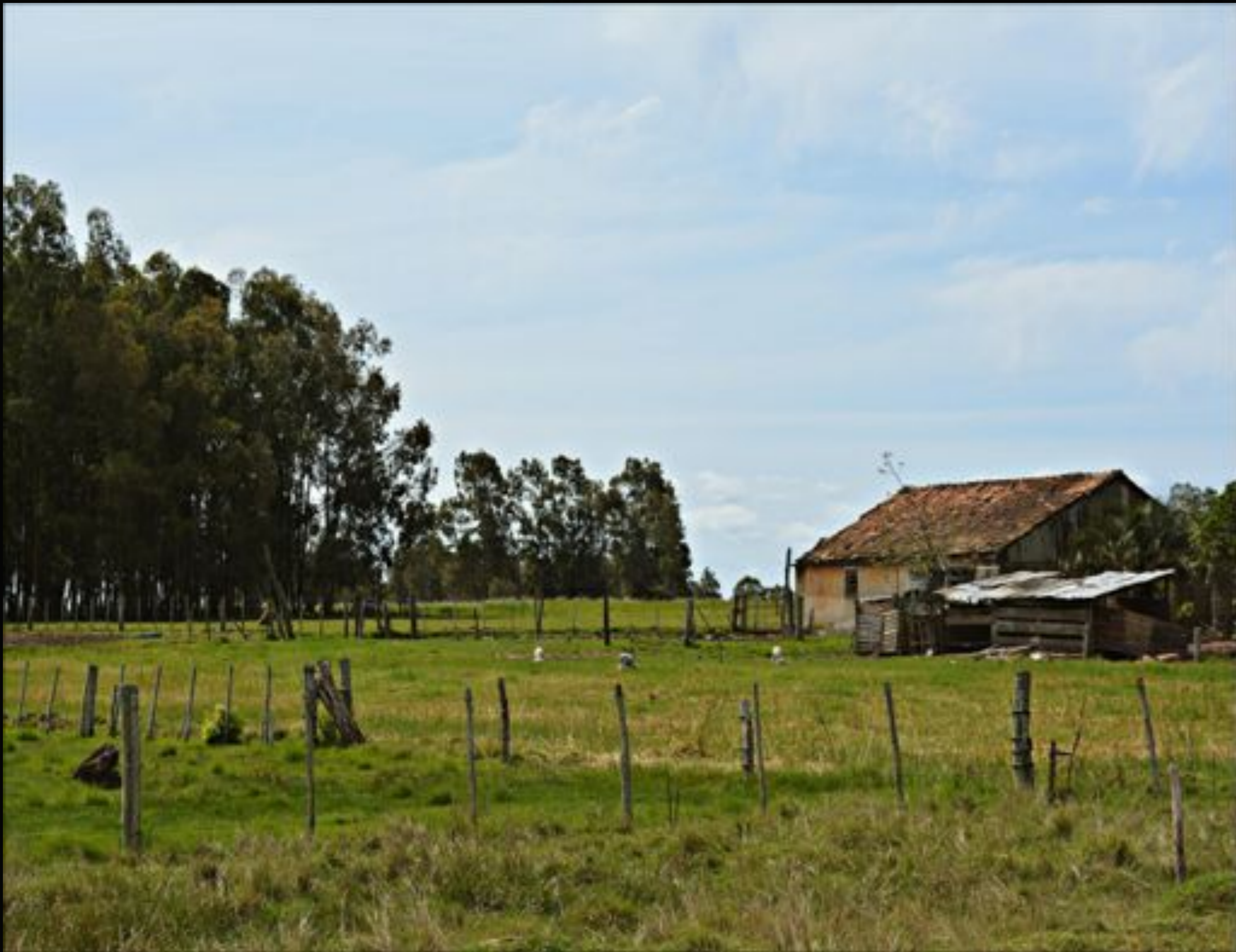
Fonte: Entorno rural de Jaguarão.