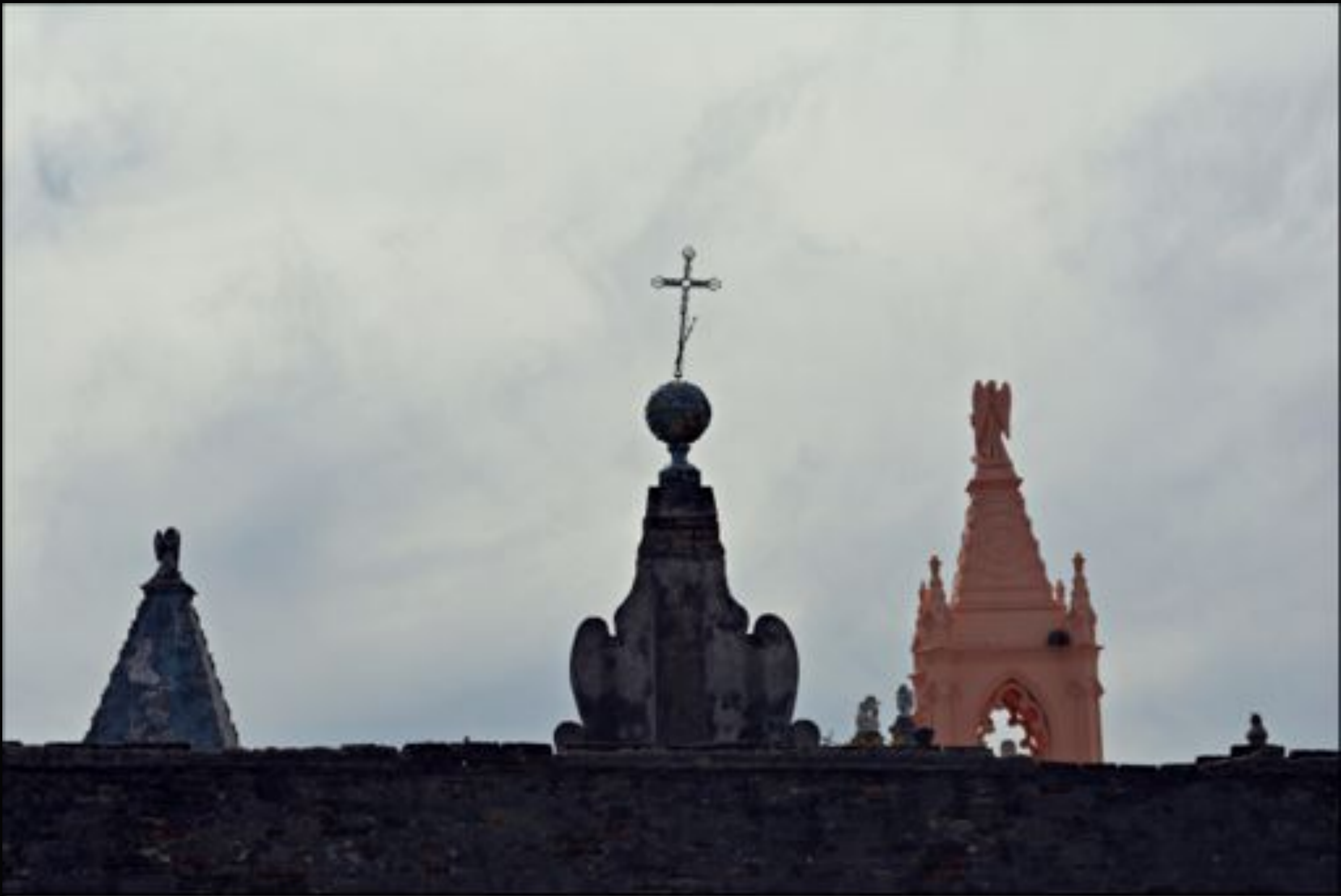
Fonte: Torres de Jazigos - Cemitério das Irmandades.