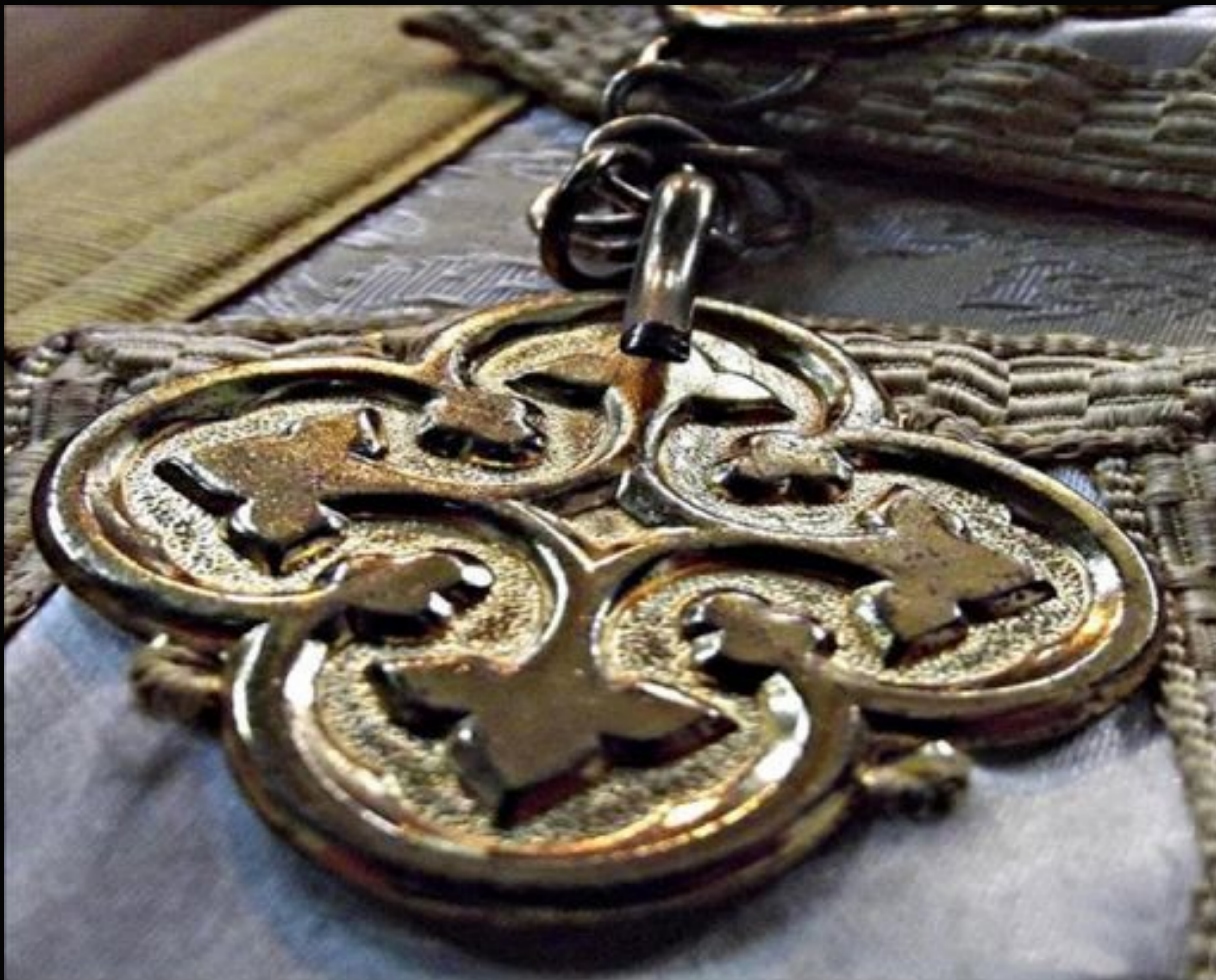
Fonte: Brocado do véu umeral sacerdotal da Pároquia do Divino Espírito Santo.