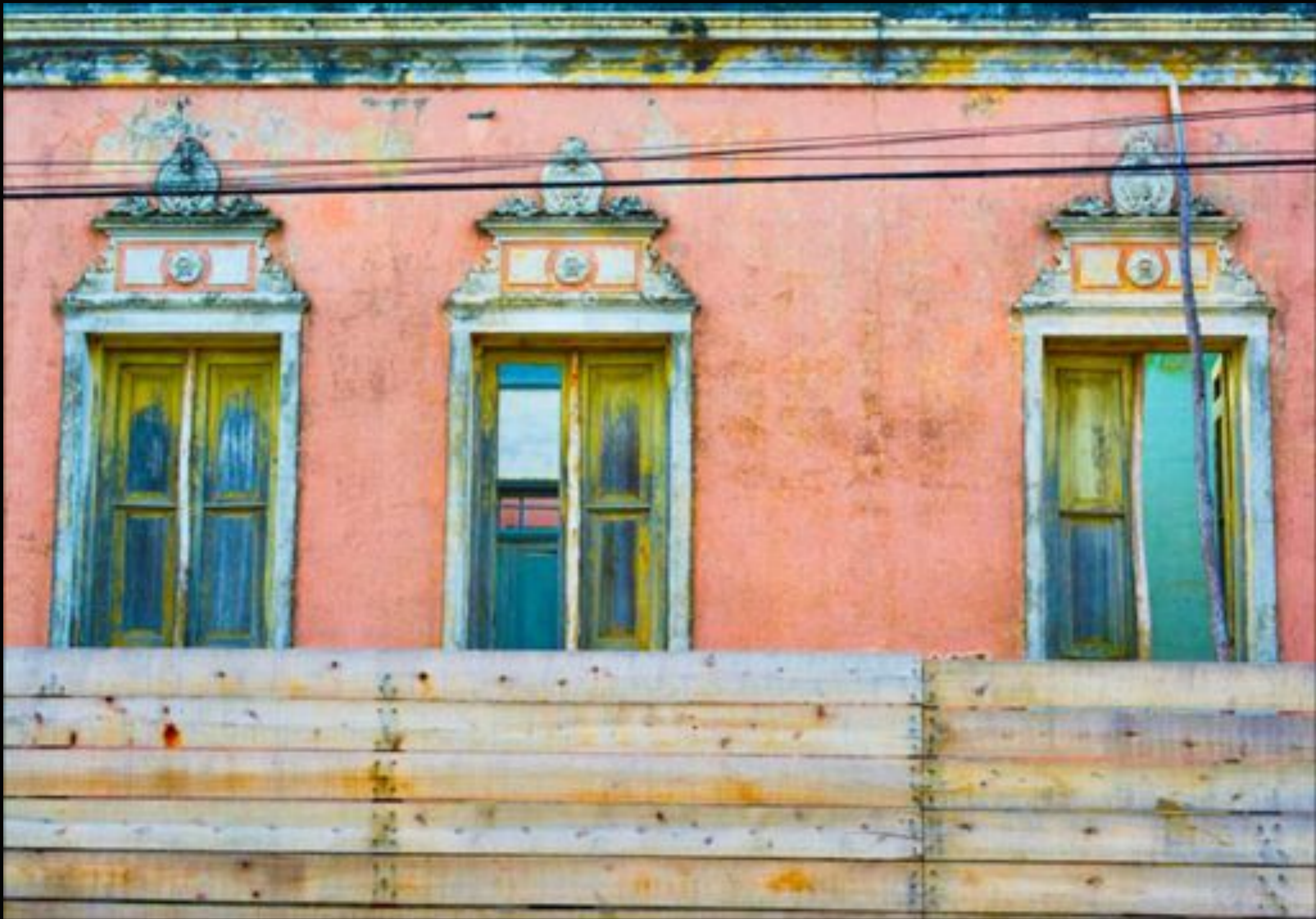
Fonte: Fachada da antiga Inspetoria Veterinária.