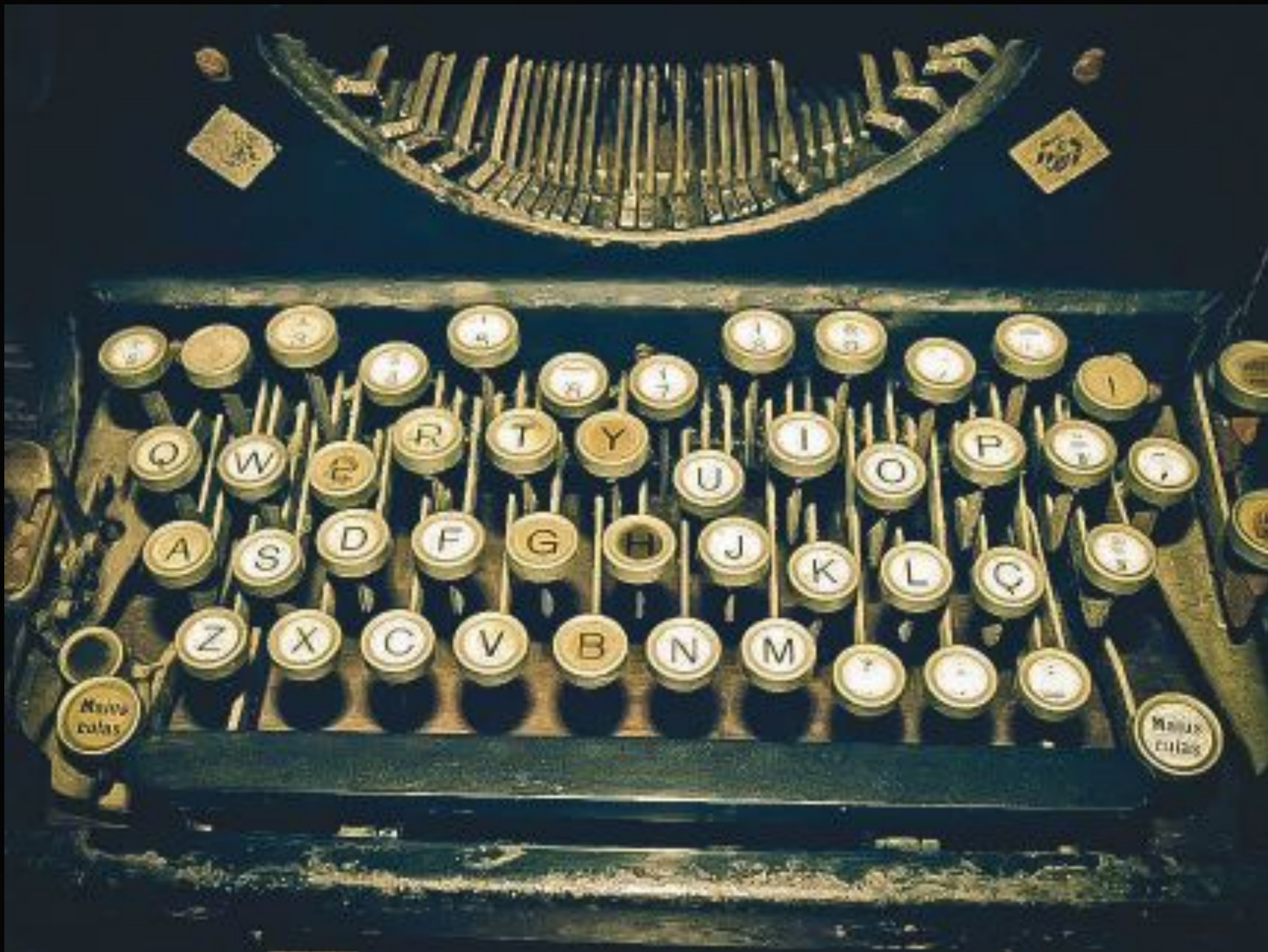
Fonte: Máquina de escrever, ano 1921.