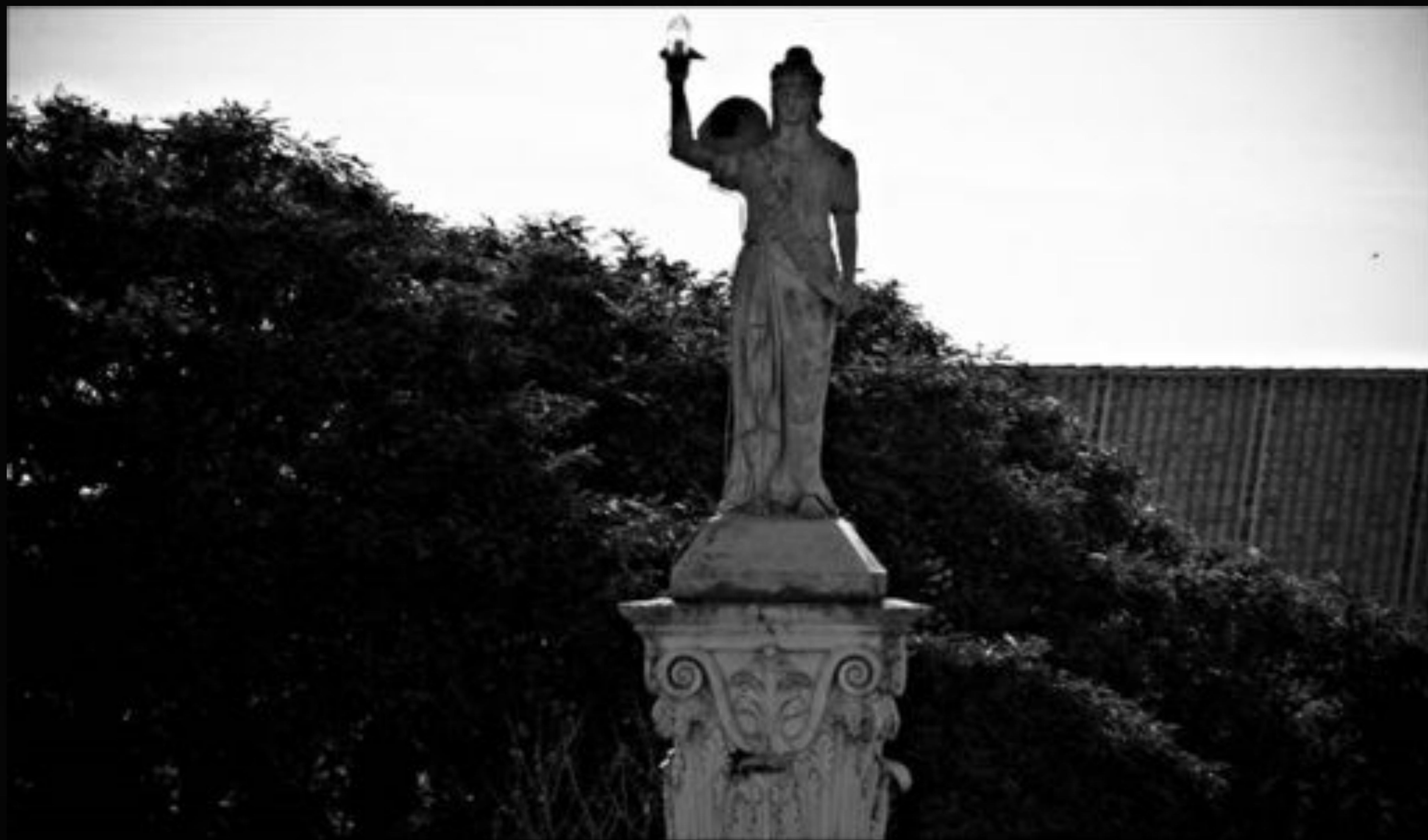
Estátua da Liberdade - Praça Dr. Alcides Marques.