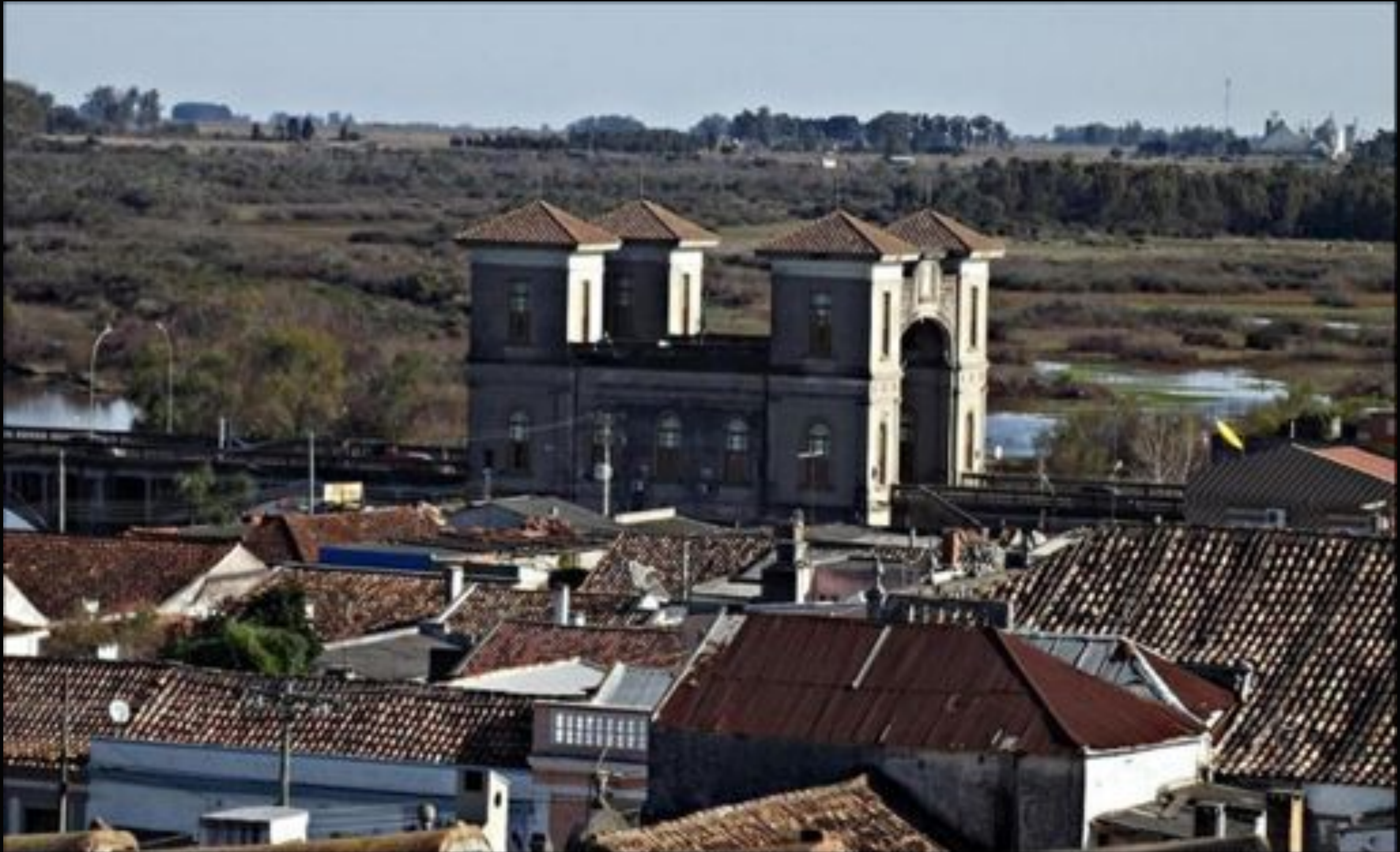
Fonte: Ponte Internacional Barão de Mauá.