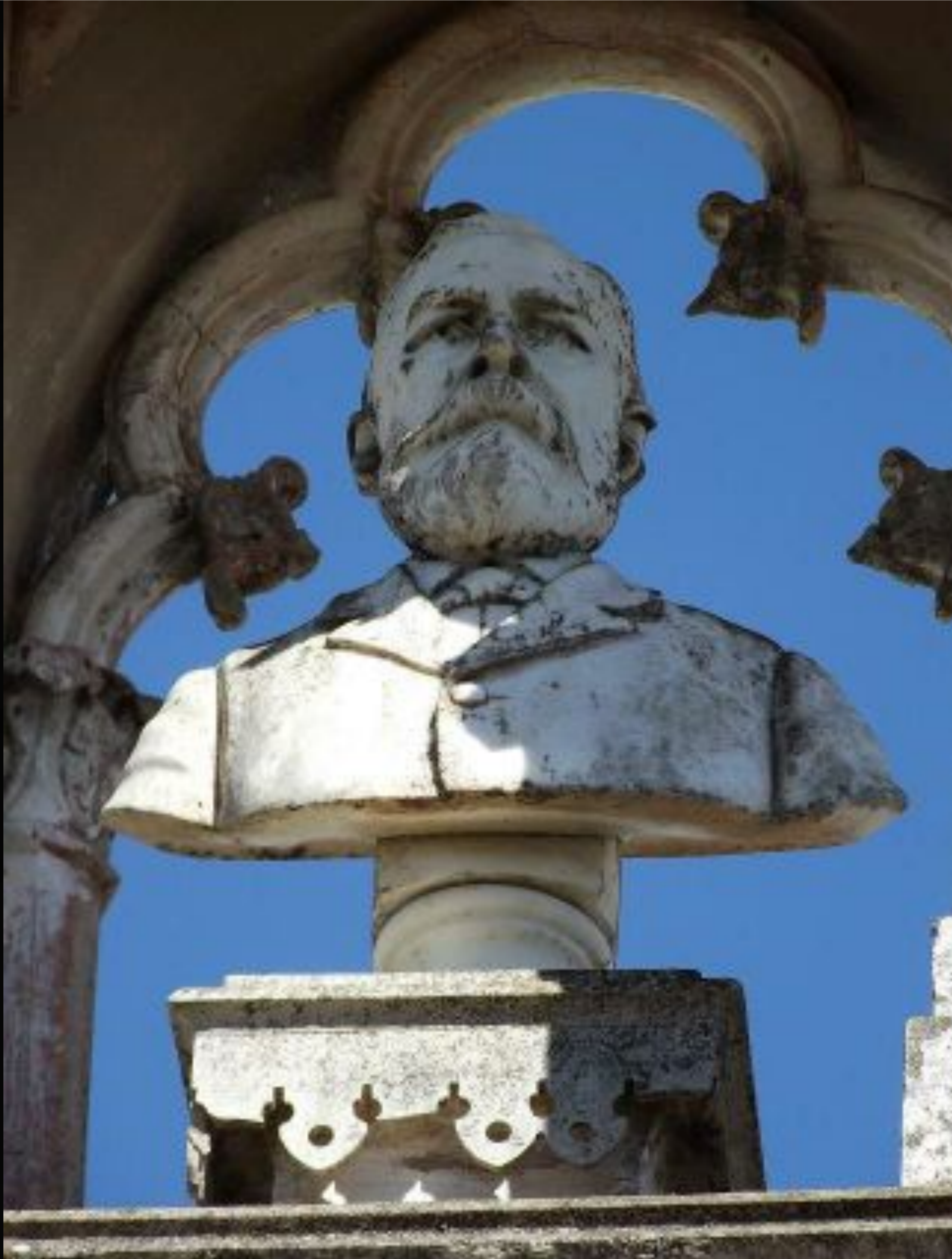
Fonte: Busto do Coronel Manuel Marques de Souza - Cemitério das Irmandades.