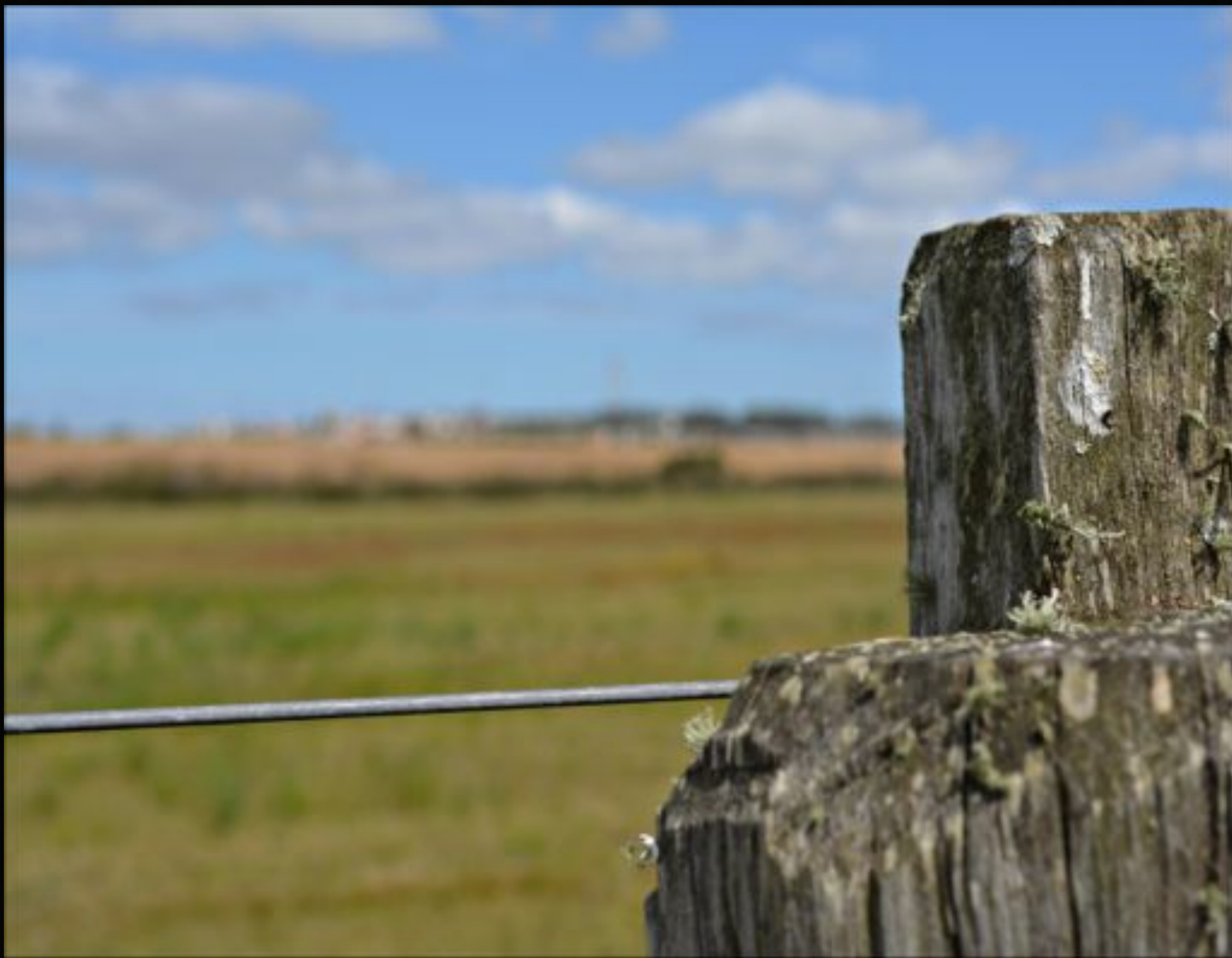
Zona Rural de Jaguarão.