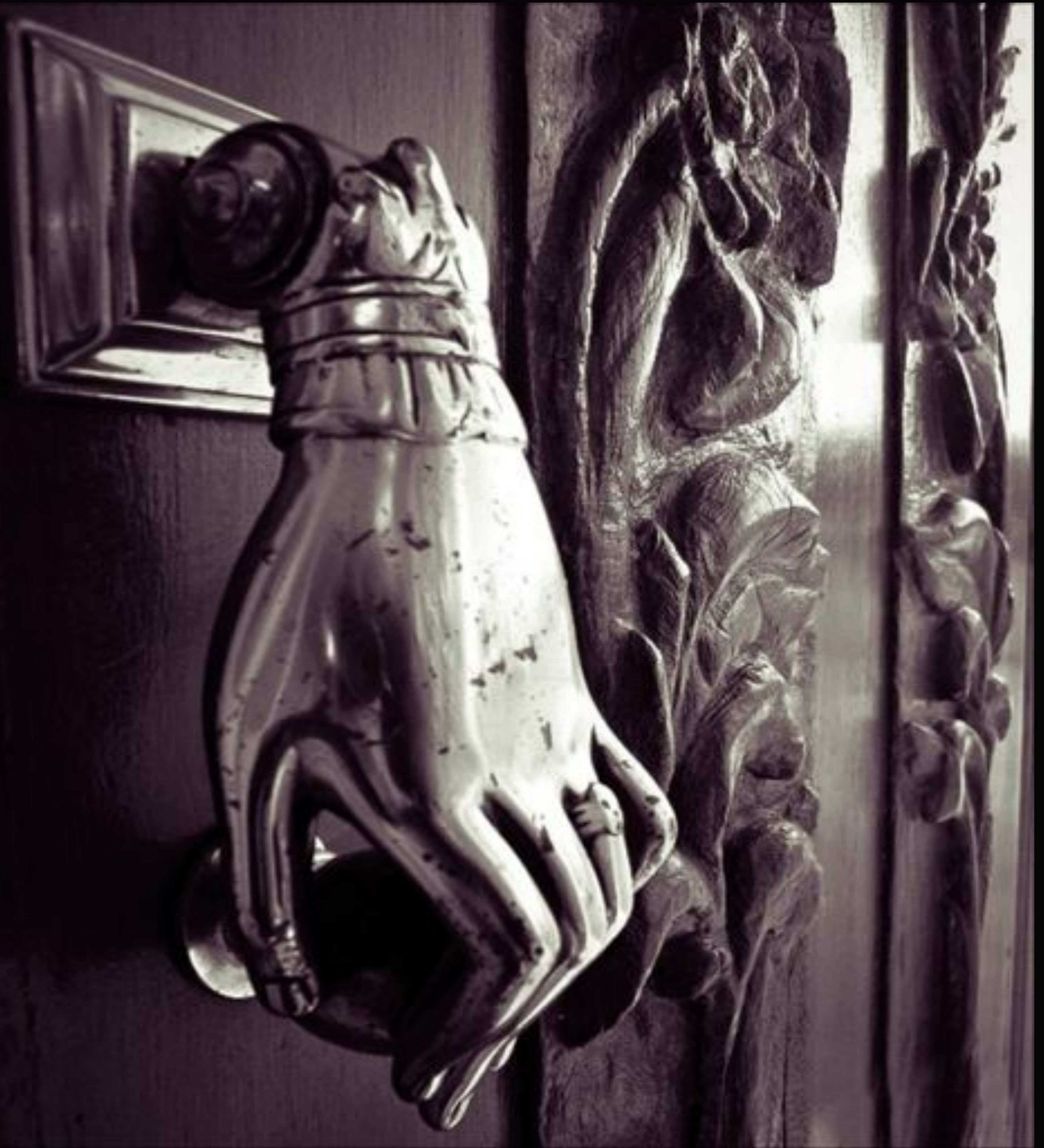
Casa paroquial da Igreja do Divino Espírito Santo.